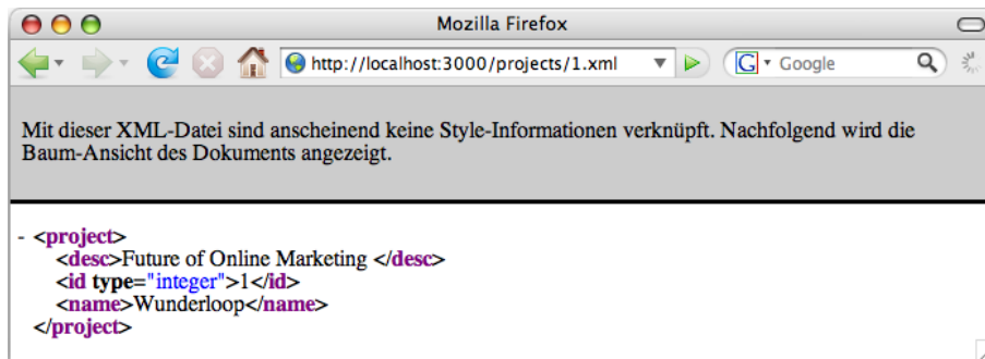
Abbildung 1.3: Projekt Wunderloop im XML-Format

Wir wissen jetzt, wie REST-Controller arbeiten und wie die zugehörigen Aufruf-URLs aussehen. In den folgenden beiden Abschnitten geht es um die Verwendung bzw. die Erzeugung dieser neuen URLs in Views und Controllern.